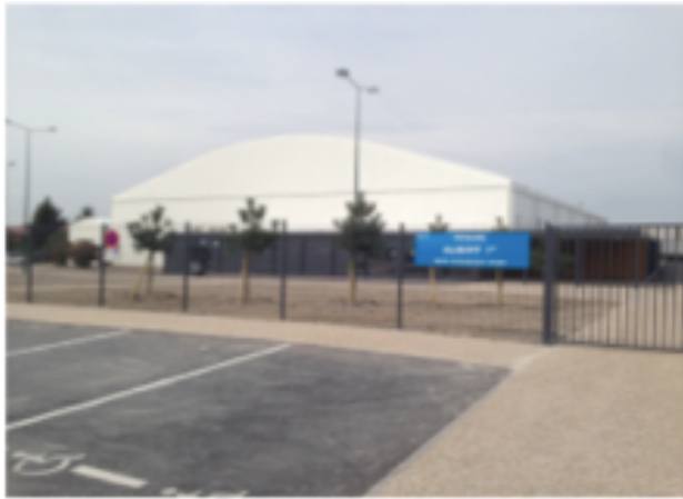
Patinoire Reims 3 millions d'euros Spatio Tempo

Couverture en membrane, (Structure Tentes Chapiteaux ) 4 fois moins cher, 4 mois de travaux, évolutif, durée de vie jusqu'à 20 ans, performances énergétiques équivalentes, performances technico sportives équivalentes