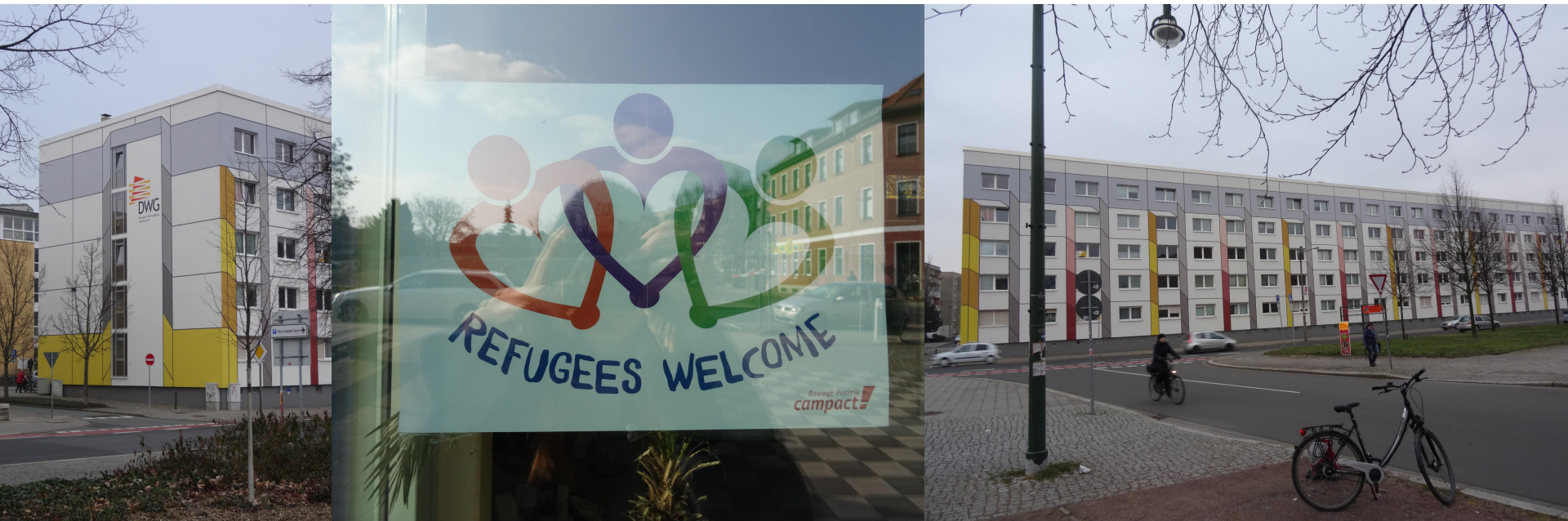
Immeuble social de la DWG, Dessau - J. Lenouvel, mars 2016