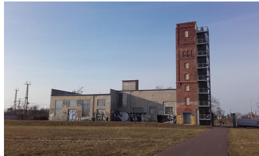
Bâti industriel désaffecté, Dessau-Rosslau, mars 2016