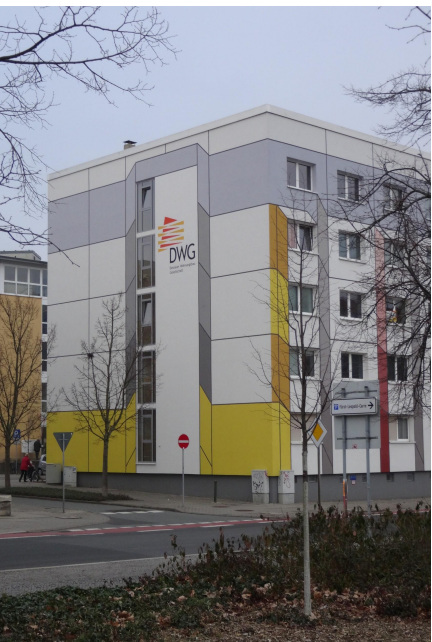
Immeuble social de la DWG, Dessau - J. Lenouvel, mars 2016

Parcours administratif des démarches d'un réfugié pour avoir les papiers et pouvoir travailler