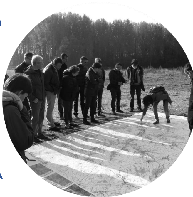
Séance « hors les murs » : marche commentée