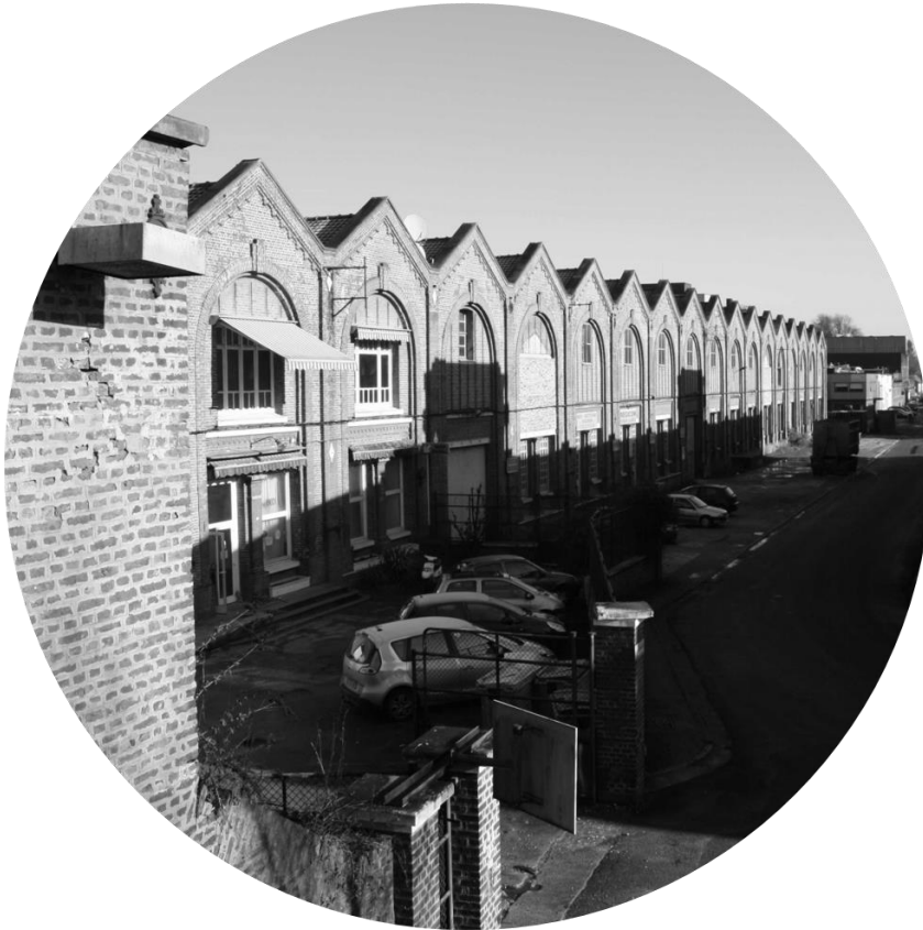
Anciens bâtiments Saint-Frères (industrie textile) - Flixecourt / Ville-le-Marclet

Constitué à la période industrielle sous l'impulsion des activités Saint-Frères, le Val de Nièvre s'est développé sur la base de dynamiques internes fortes.