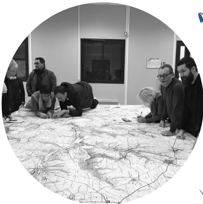
Ateliers de travail avec les élus