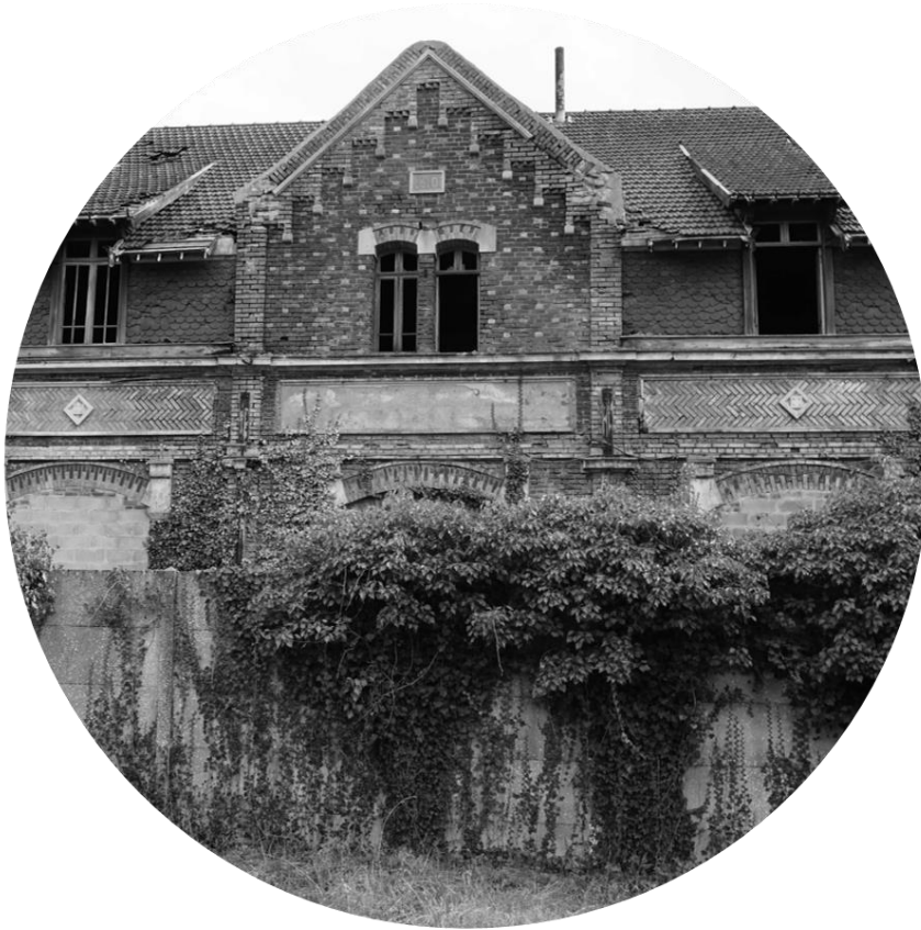
La « Prévoyance », ancien magasin coopératif - Saint-Ouen

Le déclin progressif des activités industrielles a par la suite rompu cet équilibre territorial hérité.