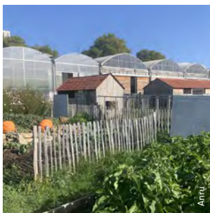
La ferme ouverte de Saint-Denis (93) exploitée par les Fermes de Gally est une ferme pédagogique et productive entourée de plusieurs quartiers prioritaires : Allende, Floréal, La Saussaie, Les Tartres, Mutualité et Clos-Saint-Lazare. Elle produit des légumes en pleine terre sur 2 ha environ, et comprend aussi des cultures sous serre et hors-sol. Elle s'inscrit dans l'histoire de la plaine des Vertus, ancienne plaine maraîchère de la Seine-Saint-Denis.

Source : Insee, recensement de la population 2019.