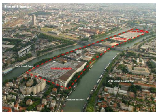
Ecoquartier fluvial Île-Saint-Denis