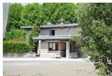
M. Paroucheville de Bondy

Pour accompagner les aménagements des ZAC, les 4 Villes ont lancé depuis 2009 une démarche d'assistance à maîtrise d'ouvrage spécialisée en développement durable (économies d'énergie, gestion des transports, dépollution, traitement des nuisances, des déchets...). Les crédits FEDER ont permis de financer le surcoût d'une démarche qui se veut exemplaire à l'échelle francilienne et qui sera particulièrement ambitieuse et qualitative dans la reconversion de sites fortement pollués en espaces à haute valeur environnementale et durable.