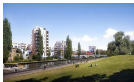
Perspective, logements et espaces publics le long du canal