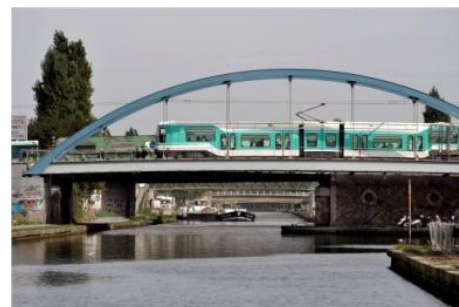
BHNS - Vue tramway PUI