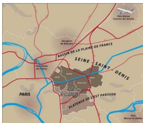
Territoire Est Ensemble

Ce document est issu de la publication « La politique régionale européenne en Île-de-France 2007-2013 – Le FEDER favorise et structure le développement économique ou l’innovation, 10 PUI et 6 initiatives témoins », juin 2013, IAU îdF n°2.11.003.