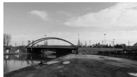
BHNS - Avant opération