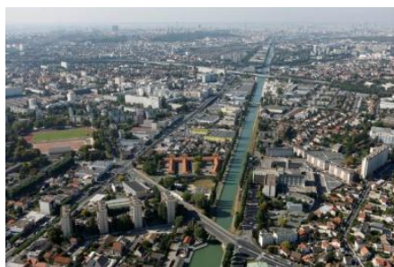
GIP des Territoires de l'Ourcq