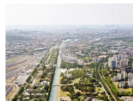
Perspective, l'Écocité à l'horizon 2020