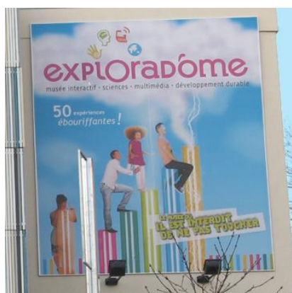
Affiche figurant sur le bâtiment