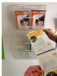
Le livret pédagogique