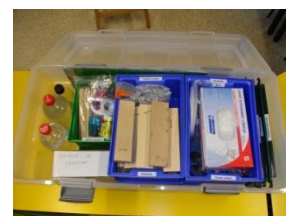
La mallette pédagogique