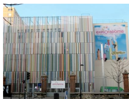
Le bâtiment 2010