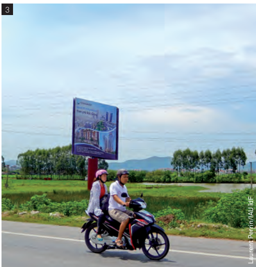
Laurent Perrin/IAU îdF