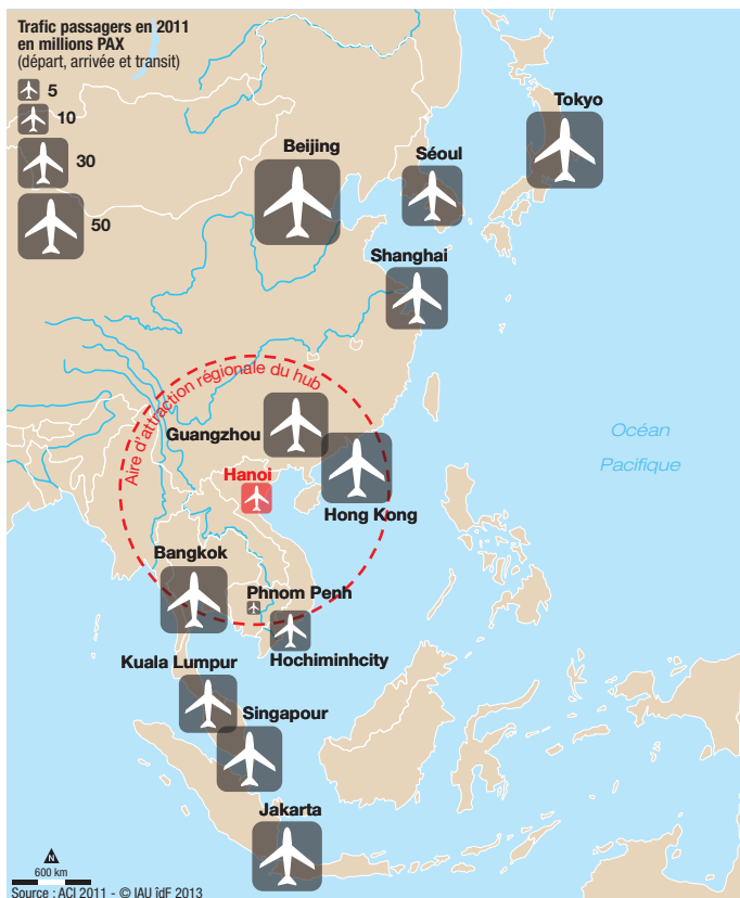
Position du hub aéroportuaire d'Hanoi dans son environnement régional