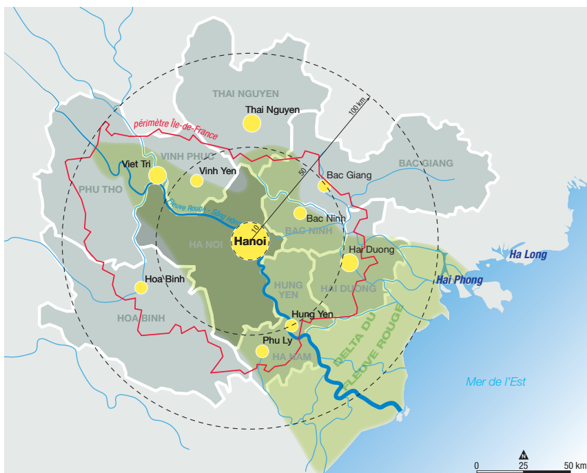
Au centre de la région, la ville-province d'Hanoi, largement étendue à l'ouest depuis 2008. En vert, le delta du Fleuve rouge, puissante artère fluviale dont la largeur avoisine 1,2 km, au droit du nouveau pont Nhat Tan.