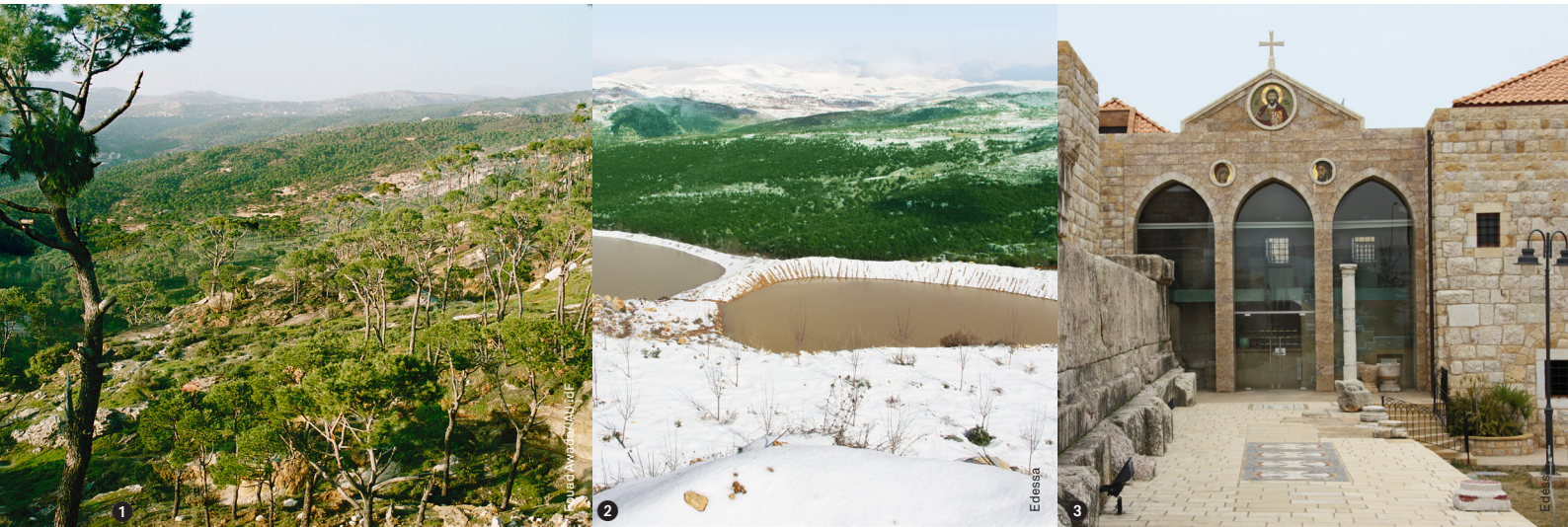
En couverture Vue de Btebyat, au cœur du Haut-Metn.