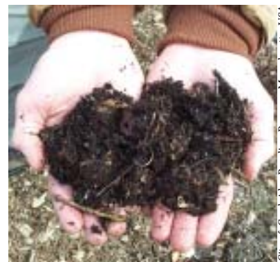
City of Cambridge Recycling Program, Massachusetts, USA

Les risques sanitaires liés au compostage sont associés au produit, le compost , et à son processus de fabrication .