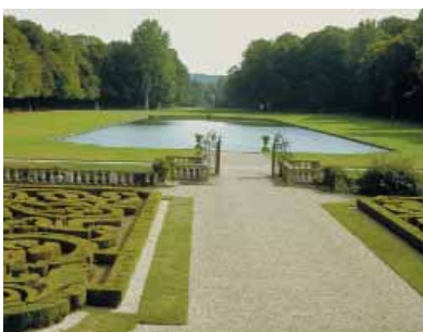
Vue du parc du domaine de Courances

Le pôle Sud-Essonne a pour thème «Sud-Essonne : jardin secret de l'Île-de-France». Le territoire intègre deux entités spécifiques : le Pays de Beauce