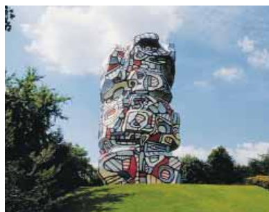
La Tour aux figures de Jean Dubuffet – Parc départemental de l'Île Saint-Germain

Le pôle Vallée de la Seine, dans les Hauts-de-Seine, regroupe onze communes entre la boucle sud de la Seine et la Défense, d'Issy-les-Moulineaux à Neuilly-sur-Seine. Le pôle s'appuie, pour agir, sur ces deux zones d'attraction forte afin de concentrer les