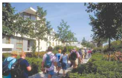
Randonnée découverte - Paris XII

Le pôle parisien a pour thèmes centraux le tourisme participatif et le