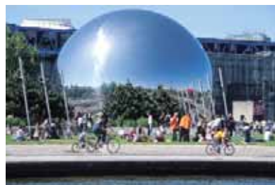
La Géode – Cité des sciences et de l'industrie – Paris-La Villette

Le thème du pôle du Nord-Est parisien, en Seine-Saint-Denis, tient en deux affirmations : «À deux pas du cœur de Paris, un territoire d'événements à dimension internationale, une banlieue populaire, laboratoire de la création» et «Cinq grands sites sur un même axe, pour redessiner le Paris de l'événement». Ce pôle s'est structuré autour des grands équipements culturels, touristiques et de loisirs présents sur son territoire, afin de se forger une image réellement visible de la part des acteurs locaux, mais aussi internationaux. Le schéma régional du tourisme indiquait ainsi : «Le pôle touristique permettra de mettre en synergie l'ensemble des grands sites touristiques (Stade de France, basilique de Saint-Denis, musée de l'Air et de l'Espace, la Villette, les parcs des expositions du Bourget et de Paris-Nord Villepinte, les Puces de Saint-Ouen), d'accompagner la structuration des sites existants et de concourir à la consolidation des sites forts comme les Puces de Saint-Ouen».