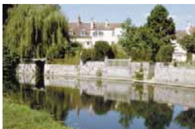
Le Grand Morin, Crécy-la-Chapelle

Dernier pôle à avoir été créé, le pôle Marne-Ourcq-Morins est centré autour des vallées de la Marne, de l'Ourcq et des deux Morin. Il est structuré par quelques villes phares, comme Meaux, la Ferté-sous-Jouarre, Coulommiers, etc. Le tourisme fluvial pourrait être l'un des thèmes principaux de ce pôle. Toutefois, la définition de sa stratégie pour les années à venir est en cours et doit permettre de structurer ce territoire et d'organiser les modalités de l'aide régionale.