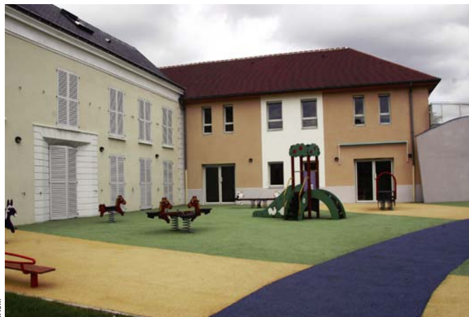
La crèche des Lucioles a été cofinancée à hauteur de 4,8 % par l'Union européenne, au titre du programme d'initiative communautaire Urban II 2000-2006.

Mesure 3. Accès aux nouvelles technologies par le développement et à la sensibilisation aux nouvelles technologies via la formation (Afpa, Greta) et le raccordement très haut débit des zones d'activités.