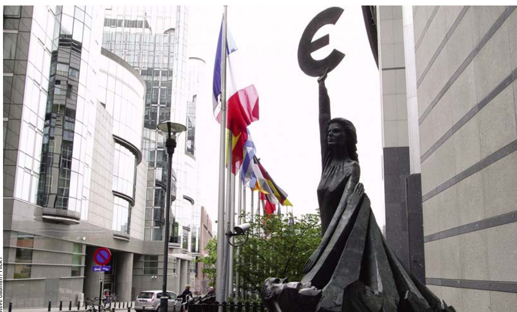
Siege Cadman / Flickr

Pour 2007-2013, l'Île-de-France compte dix projets In'Europe issus du programme opérationnel Feder de l'Union européenne. La gestion de cette politique s'appuie sur un partenariat entre le conseil régional et la préfecture de Région. Focus sur le projet de Clichy/Montfermeil.