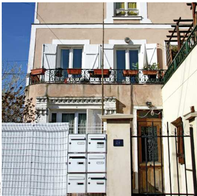
87 % des logements restructurés se situent dans le parc privé.

logements restructurés dans le Val-de-Marne). Il apparaît enfin que 30 % des ménages occupant ces logements ont des revenus annuels inférieurs à 5 000 euros. L'approche de terrain permet de constater que ces chiffres élevés et ces spécificités correspondent en fait à la transformation de deux foyers (non considérés comme des logements par Filocom) en résidences sociales que Filocom considère donc comme de nouveaux logements.