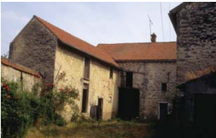
Une ferme à l'abandon à Milly-la-Forêt (91)