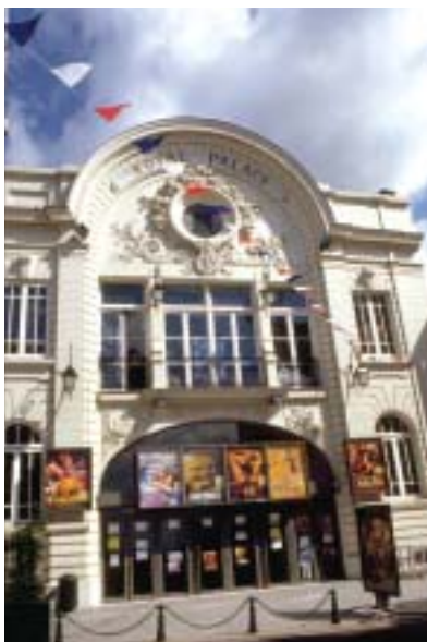
«Les nouveaux champs du patrimoine, le cinéma» Royal-Palace de Nogent-sur-Marne