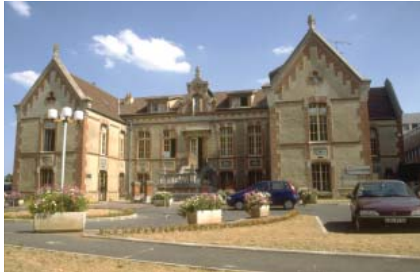
«Redonner une fonction pour sauvegarder le bâti ancien» Ancien hospice de Longjumeau reconverti en logements de fonction.

Le mouvement s'est poursuivi avec la loi dite « Démocratie de proximité » de février 2002 qui a instauré des procédures volontaires d'expérimentations