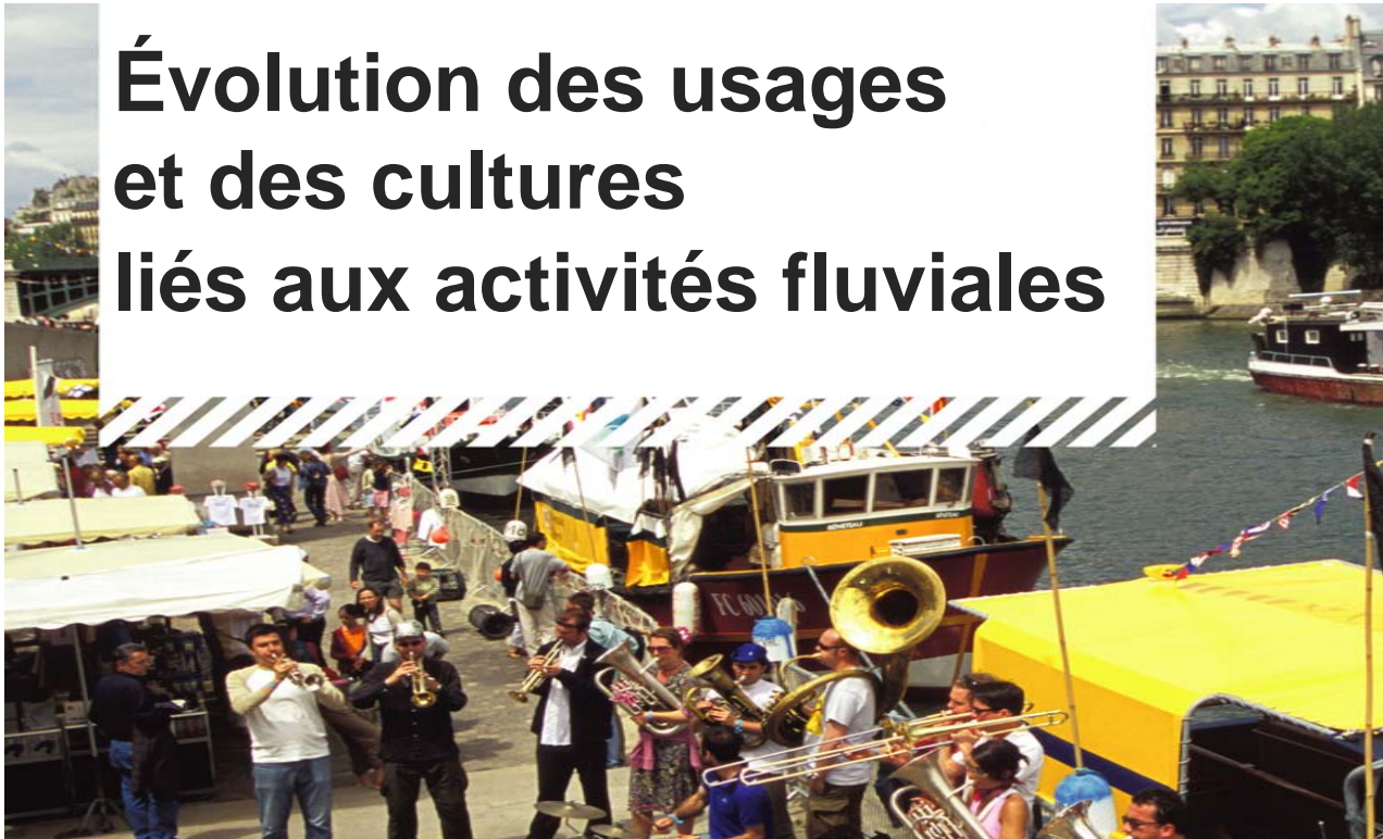
Table-ronde 5 mai 2009, IAU-îdF