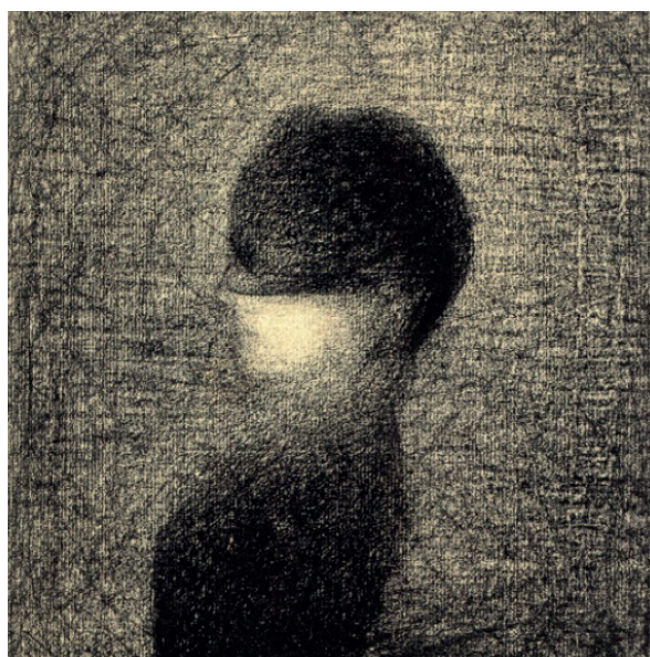
G. Seurat, La Voilette (détail). Coll. Musée d'Orsay © RMN.