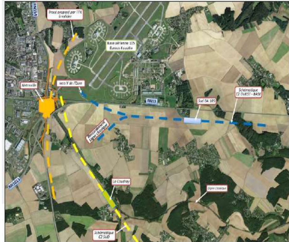
Les 3 options de la gare nouvelle