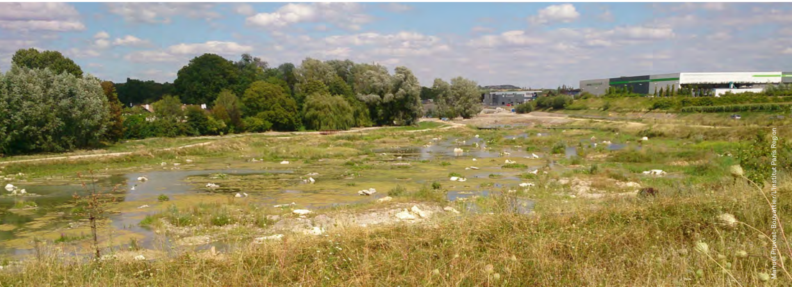
Manuel Proust-Bouquartier / Institut Paris Region