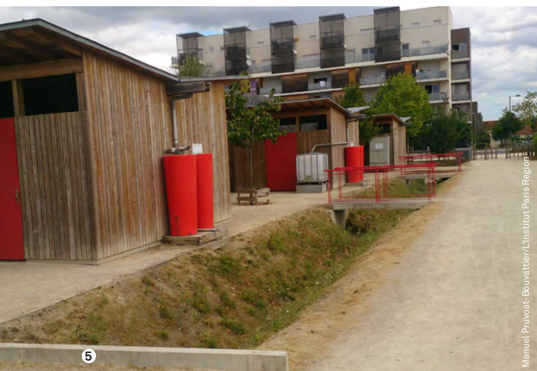
Manuel Pruvost-Bouvattier/L'Institut Paris Region