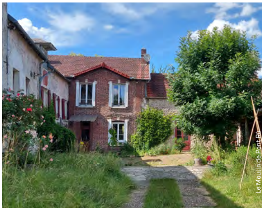
Le Moulin de Pont Rû