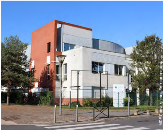
MDE Convergence Entrepreneurs